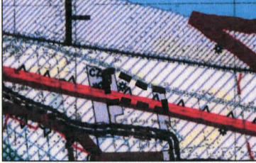
— GRANICE OBSZARU OBJĘTEGO PLANEM

STUDIUM UWARUNKOWAŃ I KIERUNKÓW ZAGOSPODAROWANIA PRZESTRZENNEGO GMINY WIELKA NIESZAWKA (WYRYS).