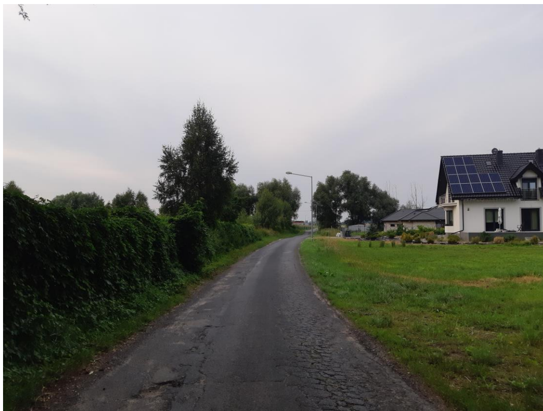
Zdjęcie nr 1. Ulica Topolowa stan istniejący

W ciągu ulicy Topolowej zlokalizowane są pobocza gruntowe porośnięte trawą, które w chwili obecnej uniemożliwiają poprawne odwodnienie ulicy.