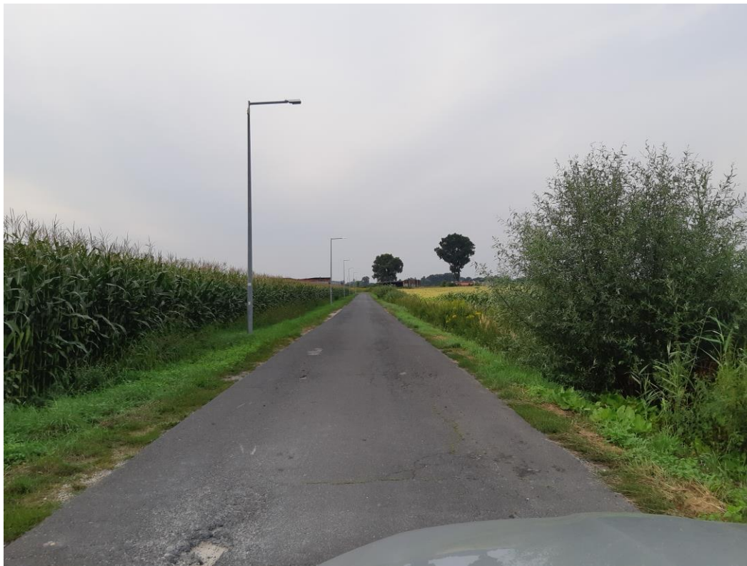
Zdjęcie nr 2. Ulica Topolowa stan istniejący

ATS – nadzór, projekty, bhp Tomasz Sulerzycki NIP 888-286-95-13; REGON 364641671 Mała Nieszawka, ul. Liliowa 38, 87-103 Wielka Nieszawka kom.668-156-167, e-mail: ats.biuro@wp.pl