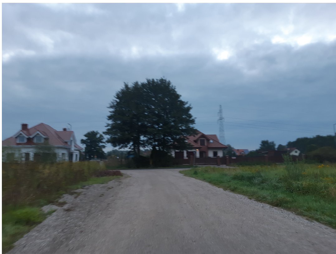
Zdjęcie nr 1 stan istniejący

Droga gminna nr 101056C ul. Liliowa na odcinku objętym opracowaniem posiada nawierzchnię częściowo utwardzoną kruszywem wapiennym łamanym 0/31,5mm, destruktem betonowym oraz nawierzchnię naturalną gruntową o szerokości 3,5 – 4,0 m bez pobocza gruntowego. Zjazdy do posesji są głównie zjazdami gruntowymi.